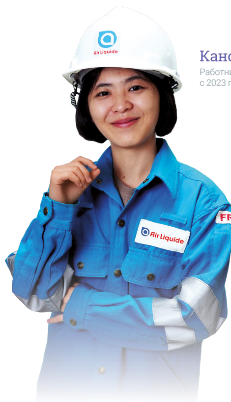
Канокпорн, Работник и Акционер с 2023 года