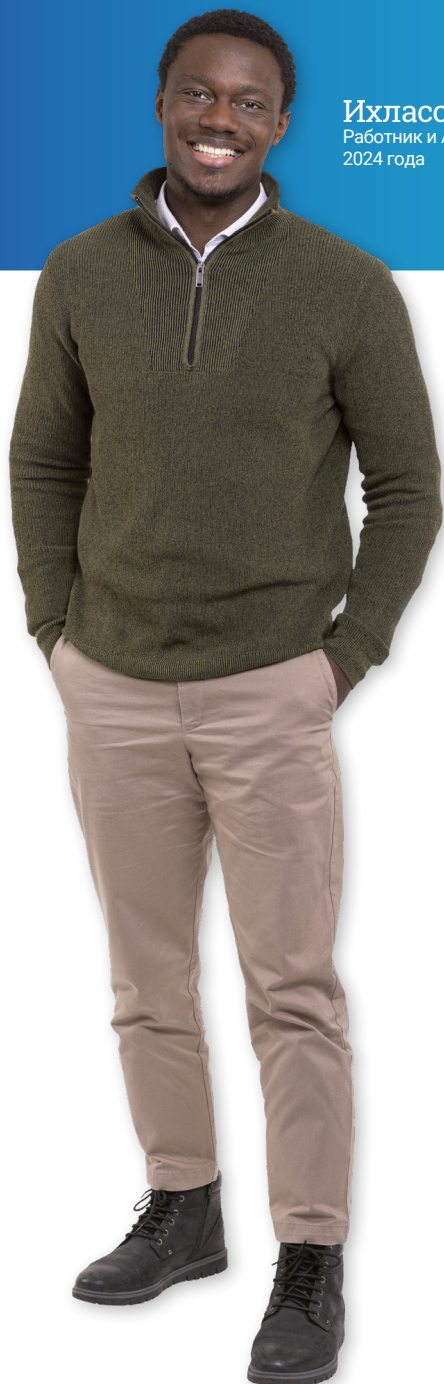
Ихласс, Работник и Акционер с 2024 года